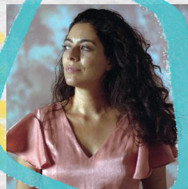
Όλγα Στεφάτου Φωτογράφος

Με αφορμή το βιβλίο του Αντώνη Παπαθεοδούλου, διευρύνουμε την οπτική μας αντίληψη και ανακαλύπτουμε οπτικές γωνίες που αντανακλούν τη ματιά μας στο σήμερα. Με τον φακό της Όλγας Στεφάτου και τη φαντασία κάθε συμμετέχουσας και συμμετέχοντα, δοκιμάζουμε να αποτυπώσουμε τη στιγμή με έναν δικό μας τρόπο - αρκεί να έχετε μαζί σας την κάμερα του κινητού σας και μια ανοιχτή καρδιά. Το εργαστήριο απευθύνεται σε εκπαιδευτικούς όλων των βαθμίδων αλλά και σε κάθε άτομο που ενδιαφέρεται. Έτσι κι αλλιώς, όλα είναι θέμα οπτικής γωνίας.